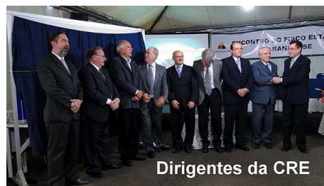
Dirigentes da CRE